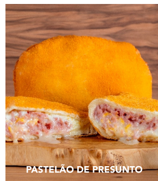
PASTELÃO DE PRESUNTO