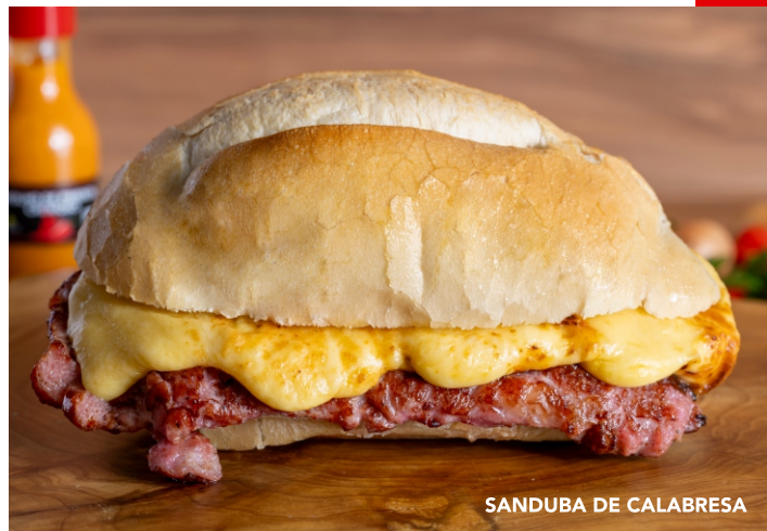
SANDUBA DE CALABRESA