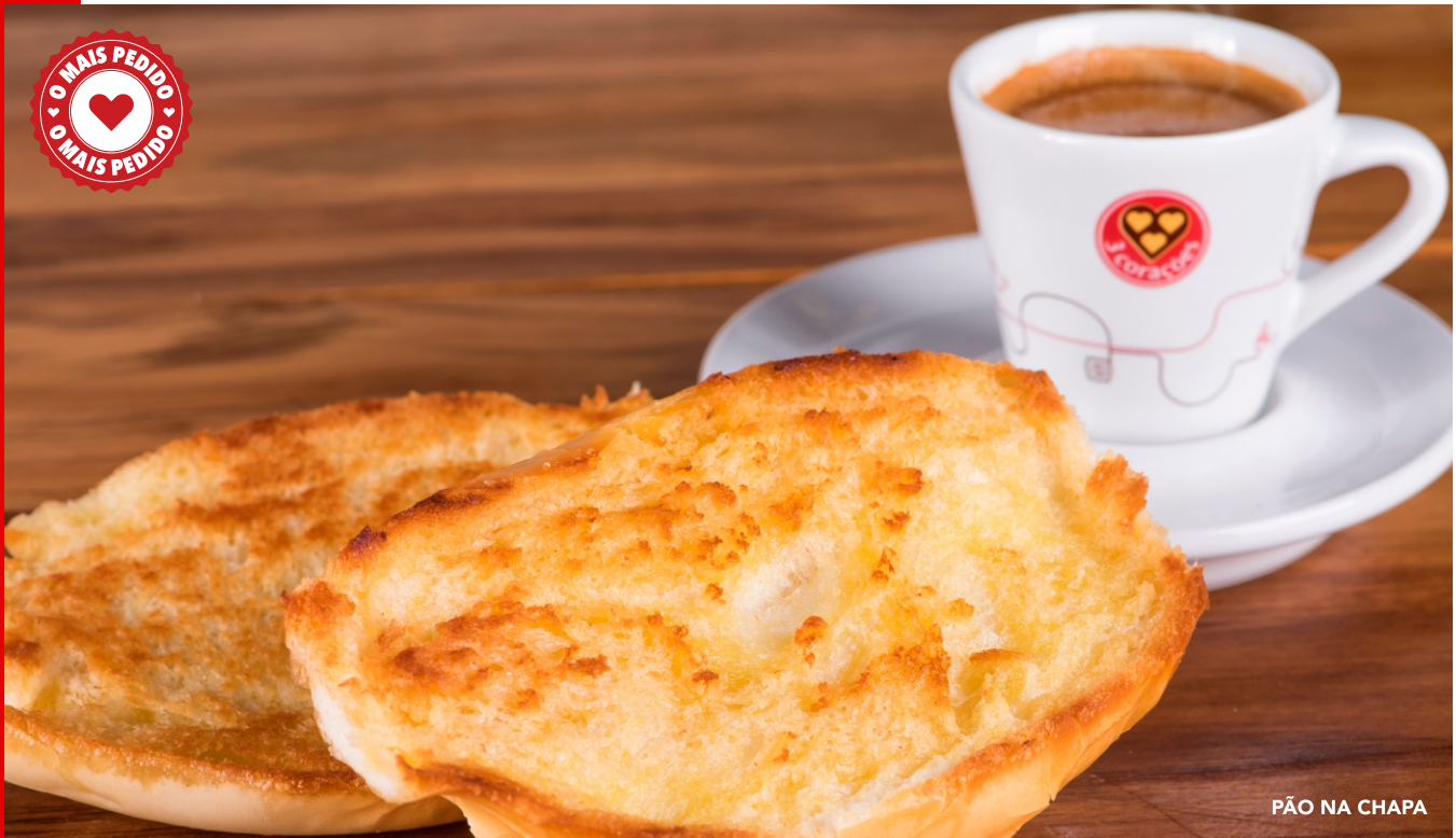
PÃO NA CHAPA