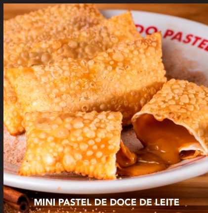
MINI PASTEL DE DOCE DE LEITE