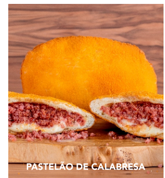
PASTELÃO DE CALABRESA