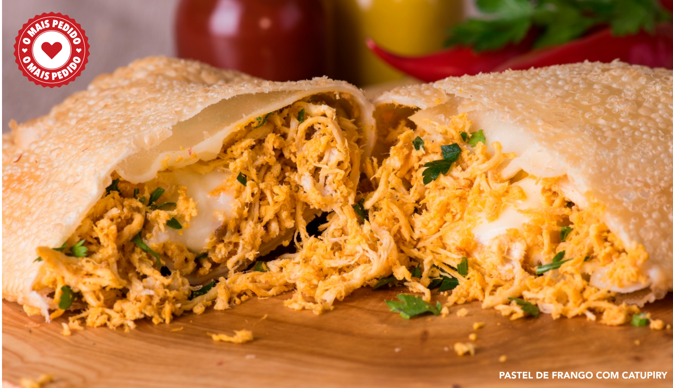
PASTEL DE FRANGO COM CATUPIRY