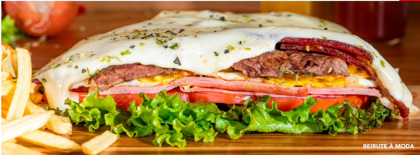
BEIRUTE À MODA