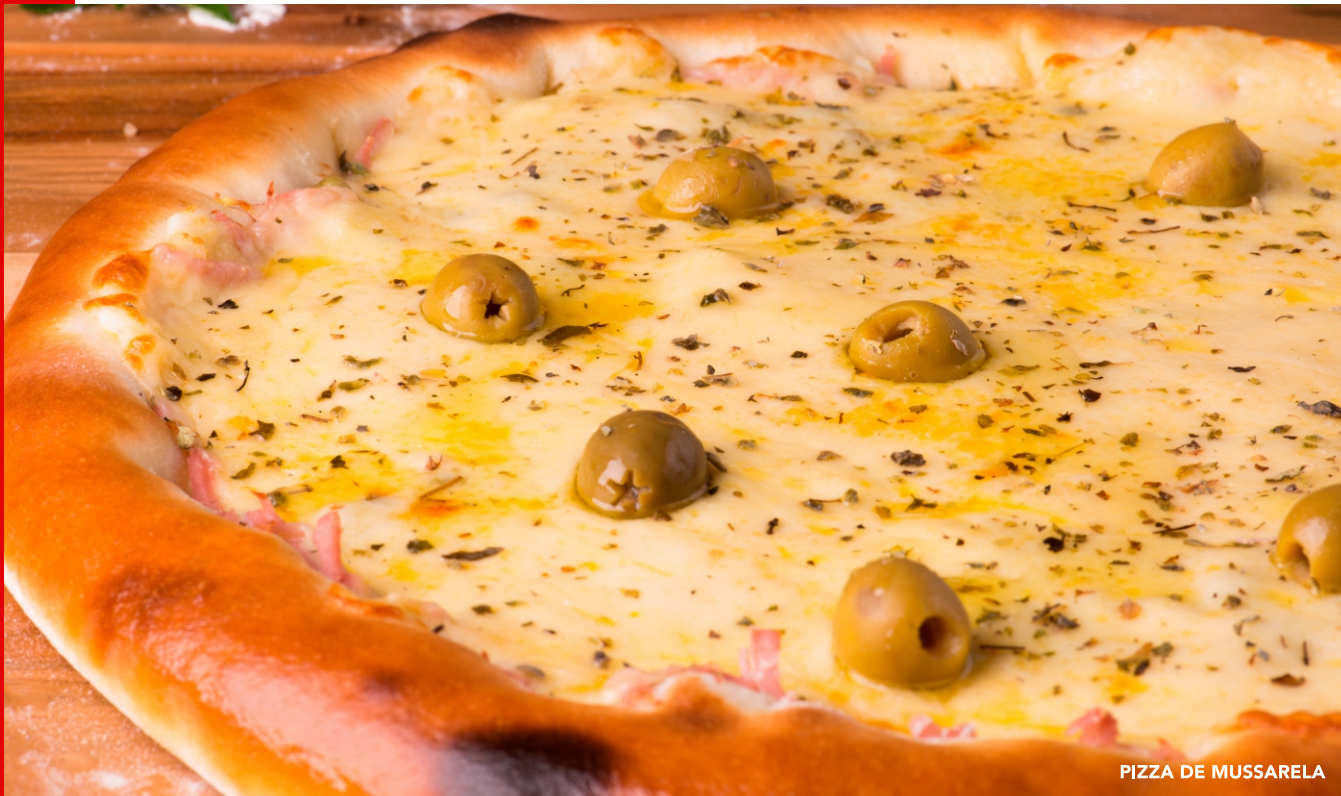
PIZZA DE MUSSARELA