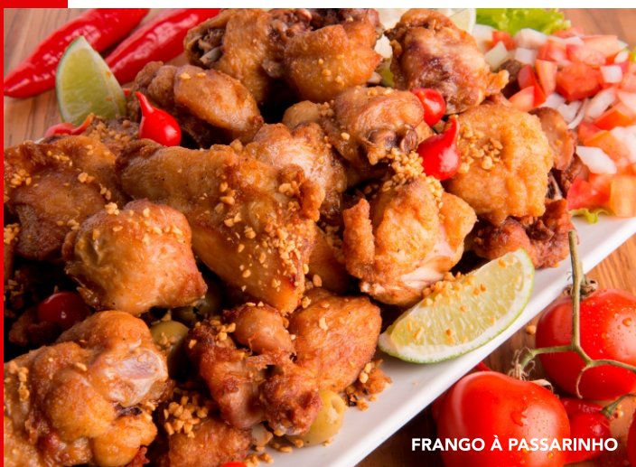
FRANGO À PASSARINHO