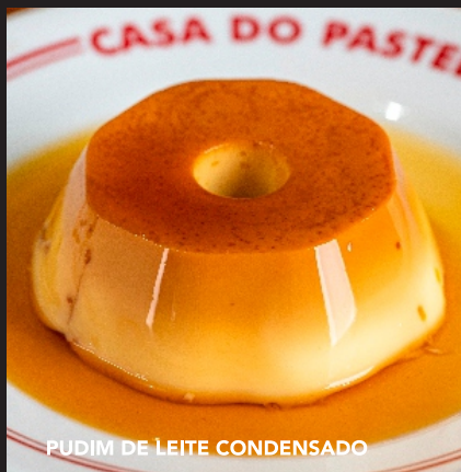
PUDIM DE LEITE CONDENSADO