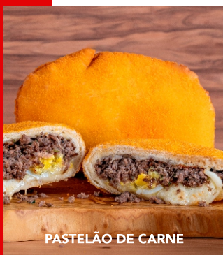
PASTELÃO DE CARNE

*Sobre pastelões feitos na hora, consulte nossos atendentes.