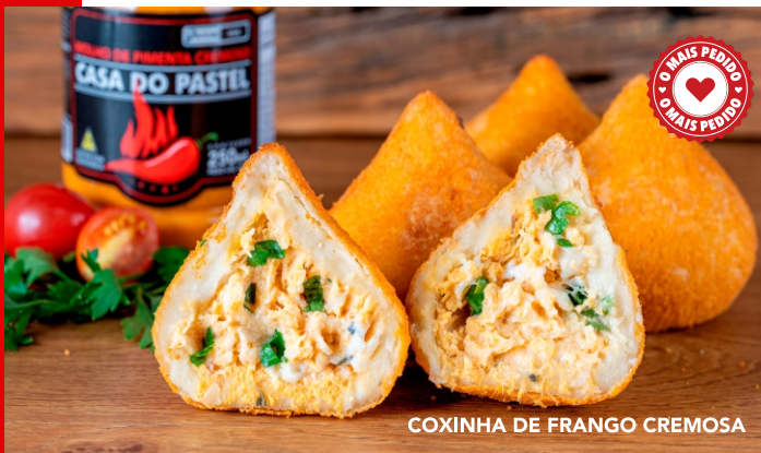
COXINHA DE FRANGO CREMOSA