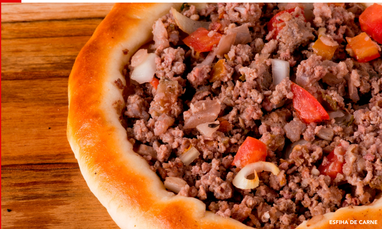
ESFIHA DE CARNE